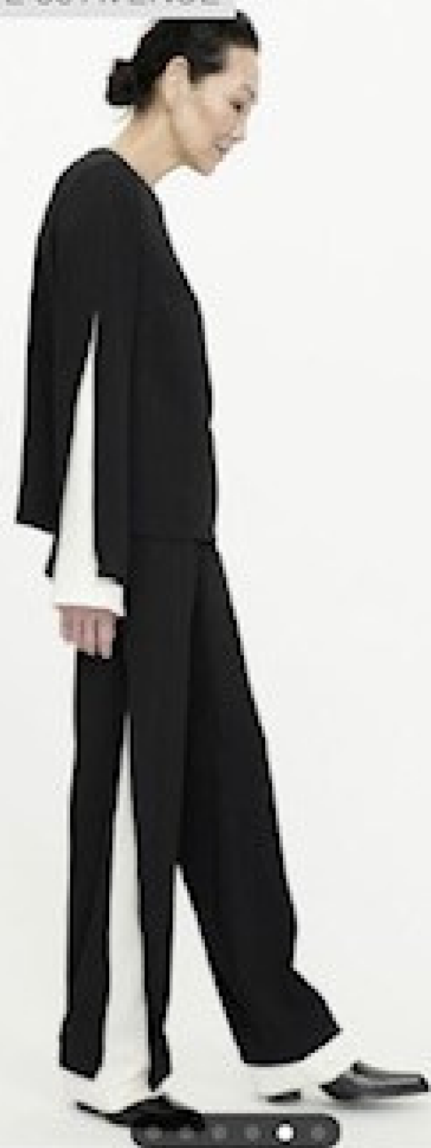
Collection Annette Götz