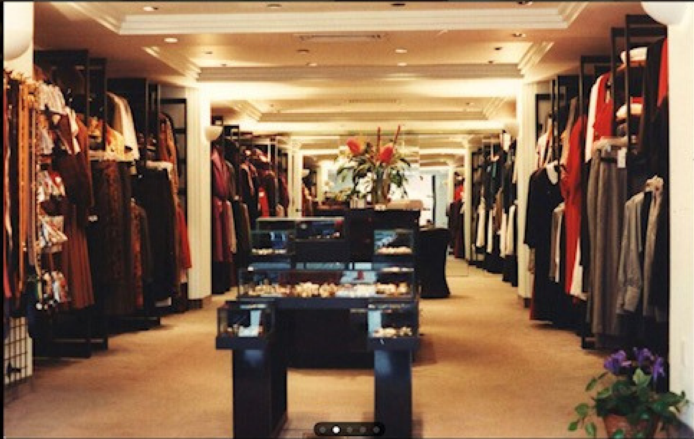
1990 : Intérieur de Boutique 5 e Avenue.