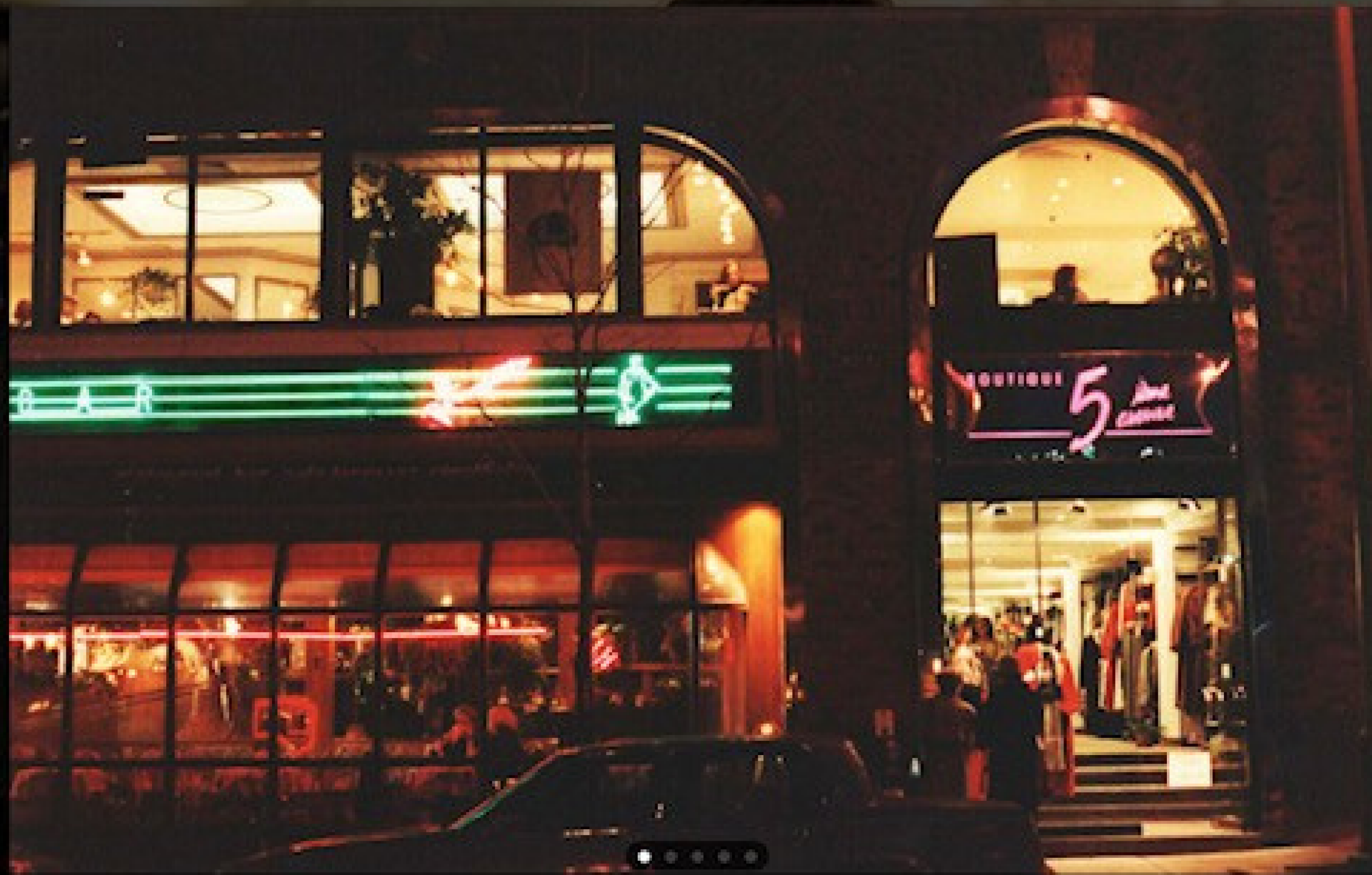
1988 : Façade originale lors de l'ouverture de Boutique 5 e Avenue sur Laurier Ouest.